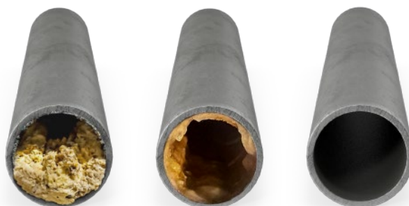
Gráfico del proceso de limpieza de grasa en la tubería con ECO-DRAIN P™ .